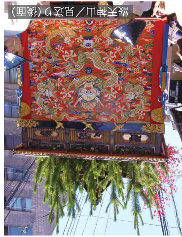
霽天神山/見送り(後面)

9:30~10:00 / 13:04~13:55 いよいよ山鉾巡行。霽天神山を徹底追跡します