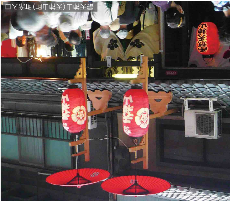
霽天神山(天神山町)町席入口