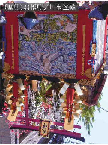
霽天神山/前掛け(前面)